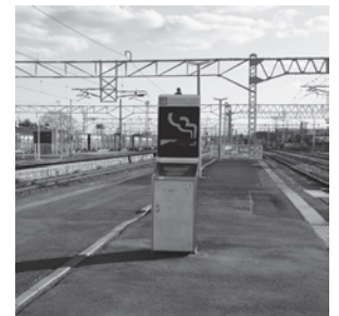
喫煙所はこんなところに…