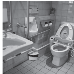
バリアフリートイレはどこに？