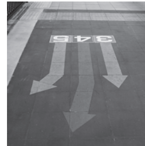
動線案内はわかりやすいかな？