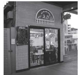
改札抜けずに入れる喫茶店が！