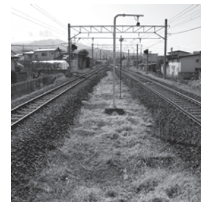
線路の幅が違う…この駅は？