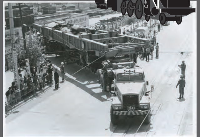
大型トレーラーに積まれたC601が、仙台駅旧貨物ヤードから西公園にむけ出発の様子