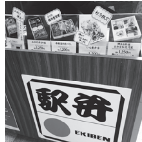
はたして弁当は買えるのか？