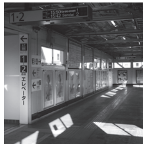
エレベーターありますか？