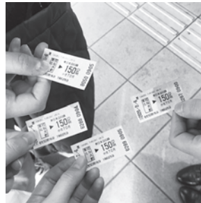
1区間切符を買っていざ出発！

*この企画展は、2020年4月に開催予定でしたがコロナウィルス感染拡大の影響で延期になっていた内容です。