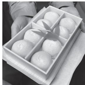
在来線では買えない名物菓子